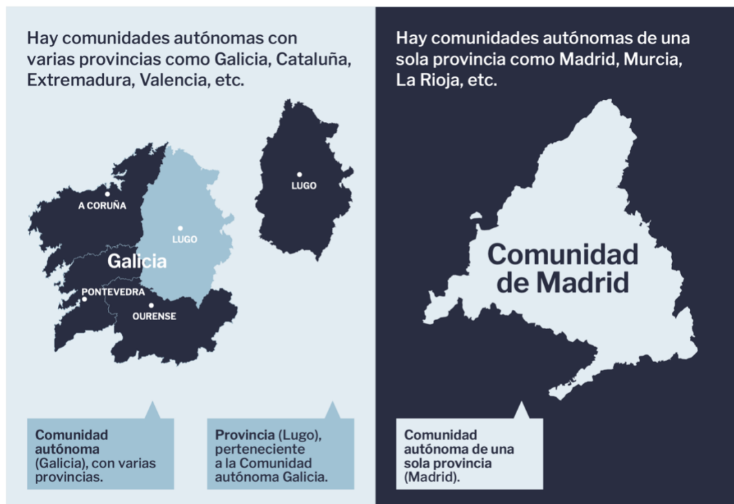
FIGURA 7. Comunidades autónomas y provincias

There are 50 provinces in Spain, to which must be added the autonomous cities of Ceuta and Melilla. The governing body of the province is the Provincial Council, except in the Canary Islands and the Balearic Islands. In the Canary Islands the governing bodies are the cabildos and in the Balearic Islands they are the island councils. The single-provincial autonomous communities do not have a provincial council.