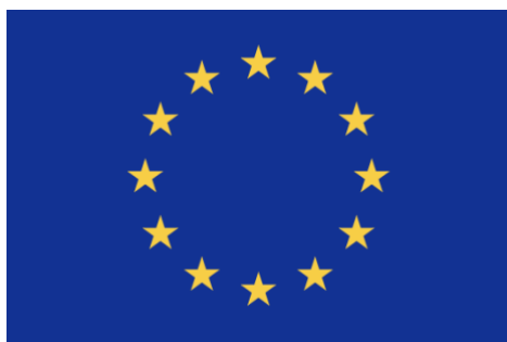
European Flag-12 Stars

Spain's representation in international organisations Spain joined the European Economic Community (now the European Union) on 1 January 1986. Since then, Spain has always played an active role in the construction of the European project. Spain has held the six-month rotating Presidency of the Council of the European Union five times: in 1989, 1995, 2002, 2010 and 2023). The flag of the European Union is blue with 12 yellow stars in a circle. Spain is also a member of other international organisations, such as the United Nations (UN); the Council of Europe (EC); the North Atlantic Treaty Organization (NATO); the International Monetary Fund (IMF) and the World Bank. A special place in Spain's international relations is occupied by the Ibero-American Community of Nations, which is made up of the 19 Latin American countries that speak Spanish and Portuguese, and the 3 of the Iberian Peninsula (Spain, the king of Spain is the head of state, has the highest representation. Their role is to act as a mediator and ensure the proper functioning of the institutions. The international support body for these 22 countries is the Ibero-American General Secretariat. The Constitution establishes the separation of executive, legislative and judicial powers, which guarantees the functioning of Spanish institutions.